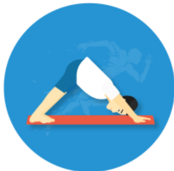
Faszien Fitness 17:15 – 18:00