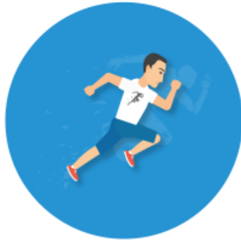
DeepWork 18:15 – 19:00