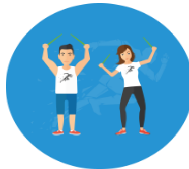
POUND 19.15 – 20:00