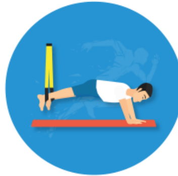
TRX 19:15 – 19:45